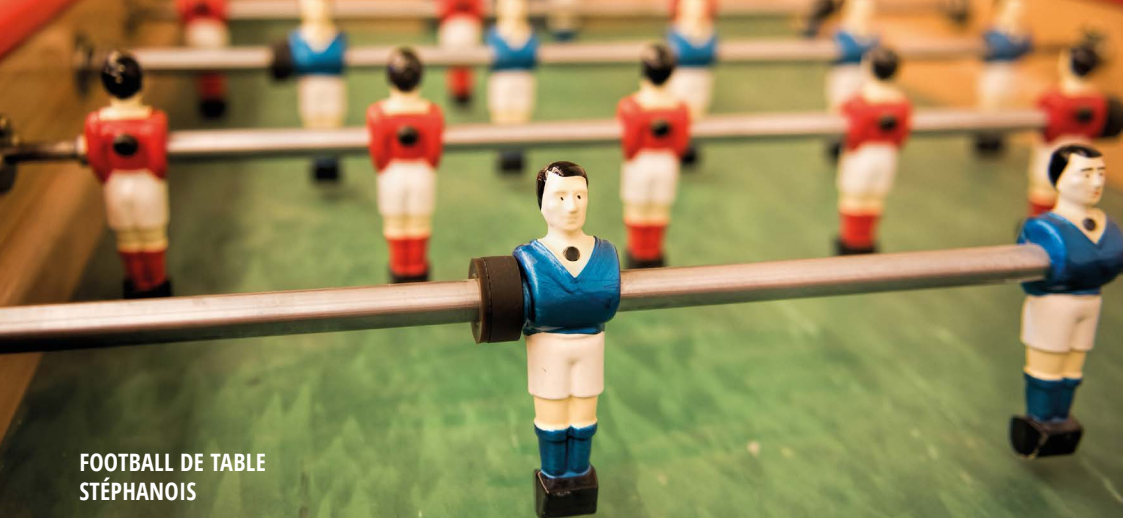
FOOTBALL DE TABLE STÉPHANOIS