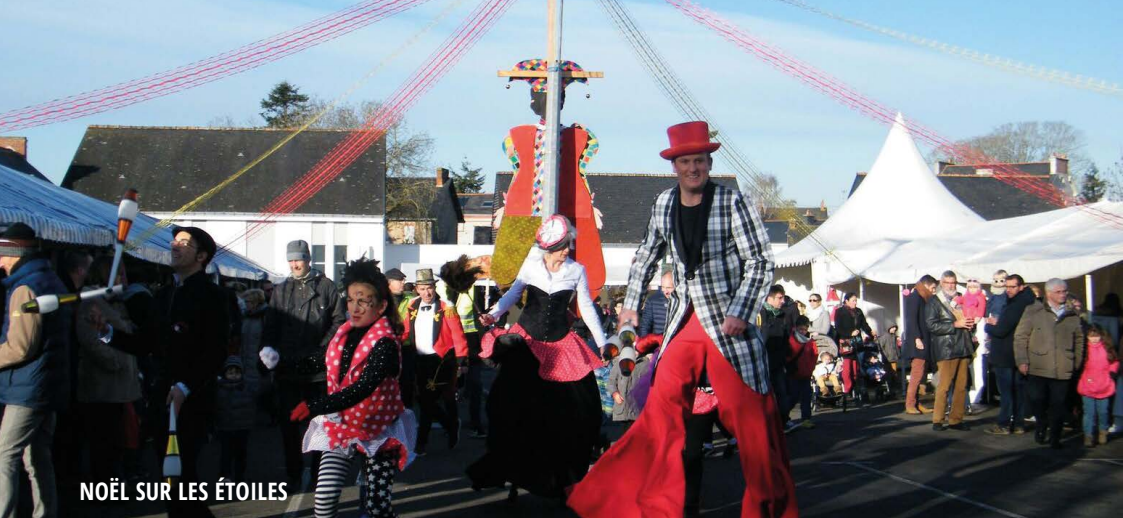
NOËL SUR LES ÉTOILES