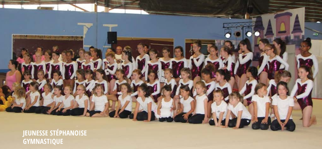
JEUNESSE STÉPHANOISE GYMNASTIQUE