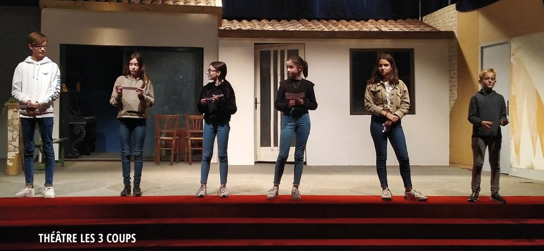
THÉÂTRE LES 3 COUPS