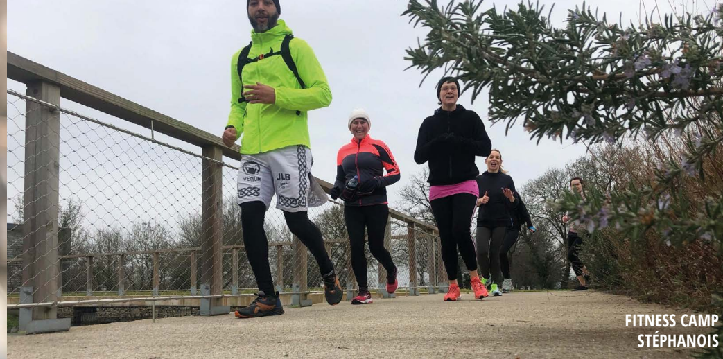
FITNESS CAMP STÉPHANOIS

clubalpin@ffcam.fr 02 40 73 64 79 http://clubalpin.nantes.ffcam.fr