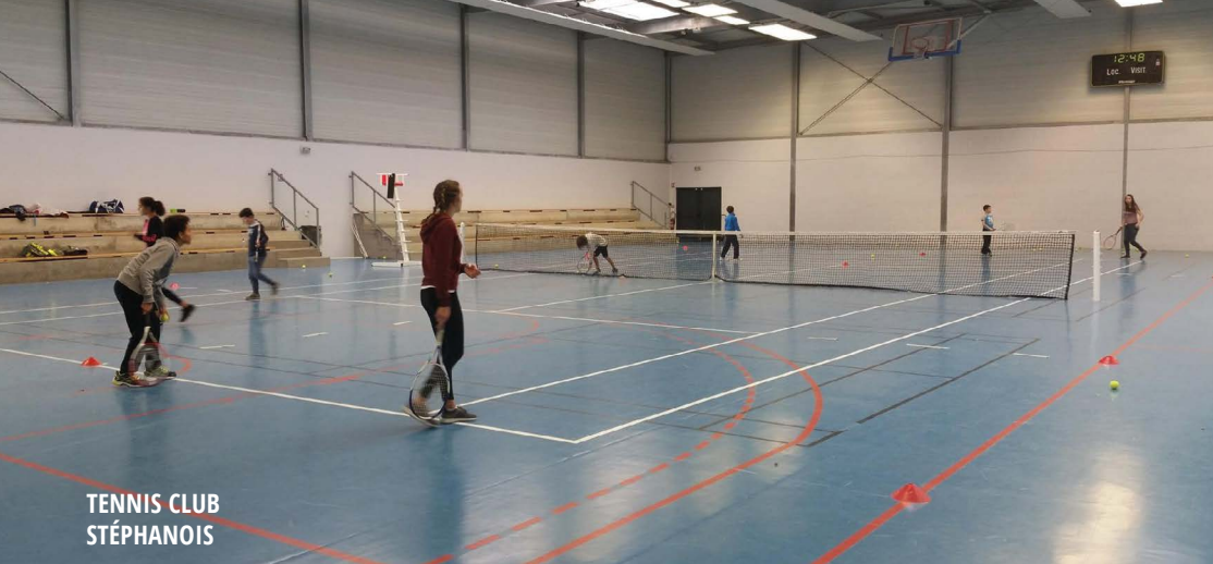
TENNIS CLUB STÉPHANOIS