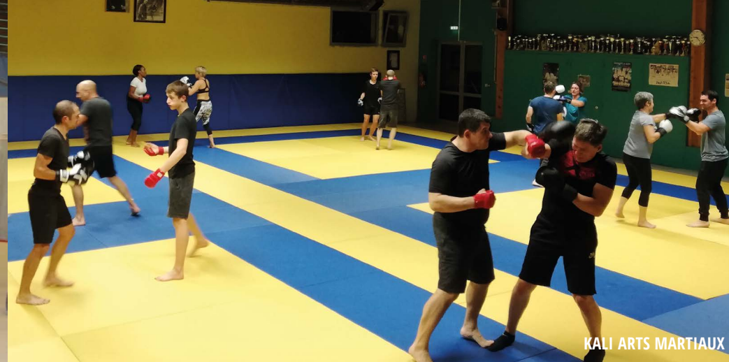
KALI ARTS MARTIAUX