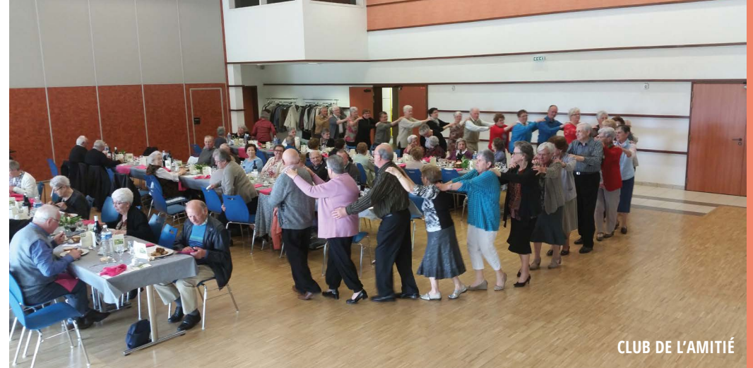
CLUB DE L'AMITIÉ