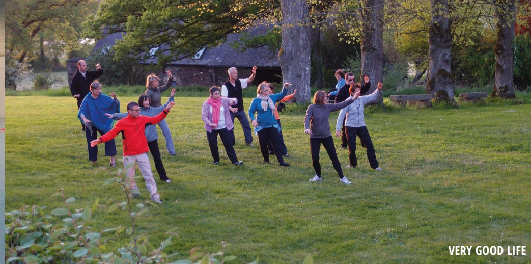
VERY GOOD LIFE