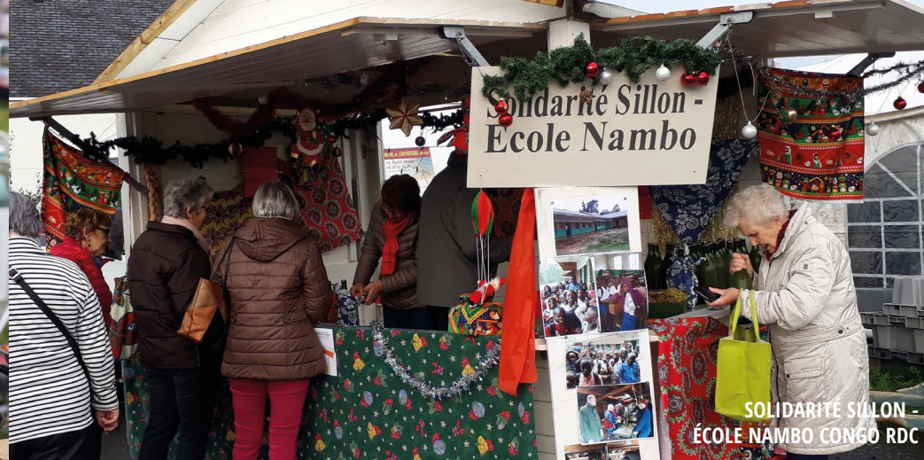
SOLIDARITÉ SILLON - ÉCOLE NAMBO CONGO RDC